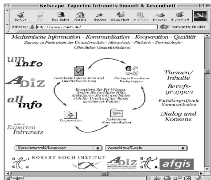
Abb. 1 ▲ Die UmInfo-Homepage im Internet

Optimalen Komfort und hohe Sicherheit bietet das System beim Zugang mit der kostenlosen Software FirstClass®. Der Zugang kann durch telefonische Direkteinwahl über 13 Regionalknoten erfolgen oder über das Internet-Protokoll „TCP-IP“. Das System kann aber auch direkt mit einem „Web-Browser“ (Netscape, Internet-Explorer) benutzt werden. Als Kosten fallen für