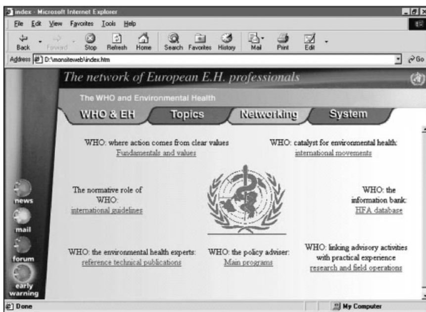
Abb. 4 ▲ Ausschnitt aus der Demo-Präsentation der geplanten europäischen Kommunikationsplattform

An das Projekt wurden folgende komplexe Aufgaben gestellt, um zukünftig in den europäischen Nationen für den Bereich „Umwelt und Gesundheit“