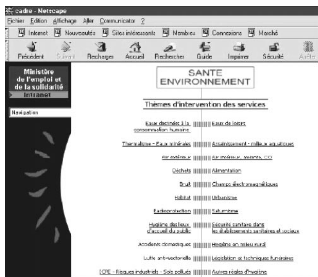
Abb.3 ▶ Der Eingangsbildschirm des RESE

Neben UmInfo, EHCnet und RESE gibt es in der europäischen Region der WHO (52 Nationen) keine weiteren zugriffsgeschützten Expertennetze für den Bereich „Umwelt und Gesundheit“. Einzelne Länder haben aber eine Verbesserung der Kommunikationen zwischen