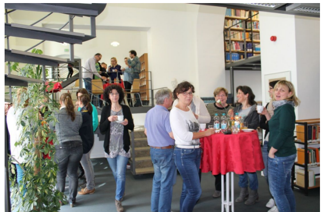
Abbildung 3: Get-together in der Bibliothek Wernigerode

In der Bibliothek findet auf Wunsch des wissenschaftlichen Personals seit April 2016 ein Get-together nach hausinternen Vorträgen statt (Abbildung 3). An diesen Veranstaltungen nehmen zwischen 15–35 Mitarbeiter und Mitarbeiterinnen der unterschiedlichsten Berufsgruppen teil.