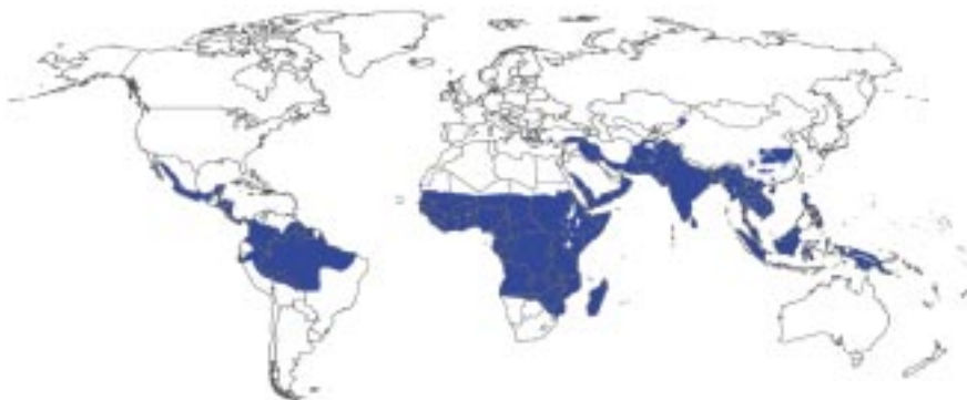
Abbildung 2 Malariaendemiegebiete nach WHO/CTD, 1997

Bei 80% der im Jahr 1999 gemeldeten 931 Fälle und bei 87% der Fälle aus Afrika handelte es sich um die lebensbedrohliche Malaria tropica. 20 Patienten sind trotz zum Teil intensiver therapeutischer Bemühungen verstorben, was bezogen auf alle Fälle mit Malaria tropica einem Anteil von immerhin 2,7% entspricht. Diese Letalitätsrate blieb im Zeitraum der letzten Jahre relativ konstant. Aufgrund einer gewissen Dunkelziffer nicht gemeldeter, leicht verlaufender Malariafälle liegt die tatsächliche Malarialetalität in Deutschland etwas niedriger. Dennoch sind die Sterbefälle angesichts der prinzipiellen Verhütbarkeit der