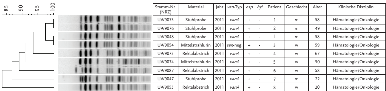
Abb. 1: Die Genotypisierung von zumeist vanA -positiven E. faecium -Isolaten mit zusätzlicher Linezolid-Resistenz mittels SmaI -Makrorestriktionsanalyse verweist auf das Vorliegen einer Ausbruchssituation.

Diese 9 E. faecium -Isolate, die 8 Patienten aus der Hämatologie/Onkologie eines Universitätsklinikums kolonisierten, verkörpern die Verbreitung des gleichen Stammes.