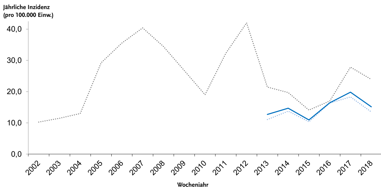
Abb. 1 | Jährliche Inzidenz der an das RKI übermittelten Pertussisfälle im Zeitraum 2002–2018.

Im Säuglingsalter erkranken Jungen etwas häufiger als Mädchen. In allen anderen Altersklassen werden mehr Erkrankungen bei Frauen bzw. Mädchen, und somit auch bei Frauen im gebärfähigen Alter, im Vergleich zu Männern bzw. Jungen übermittelt. Der geschlechterspezifische Unterschied beträgt 30%, gemittelt über alle Altersklassen.