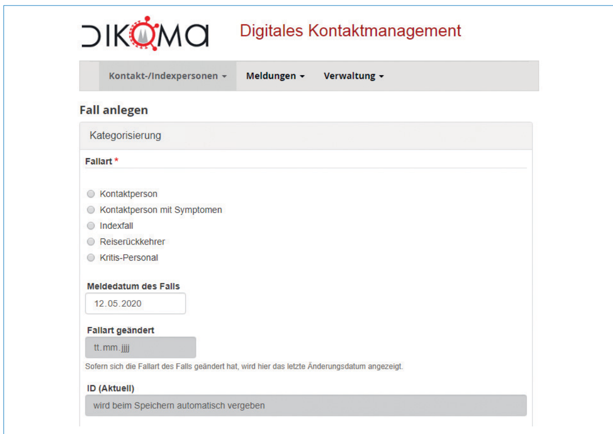
Abb. 3b | Eingangsbildschirm Fallerstellung; Gesundheitsamt und Amt für Informationsverarbeitung der Stadt Köln, April 2020