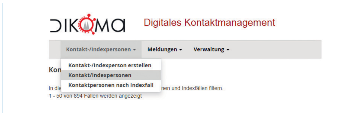
Abb. 3a | Eingangsbildschirm in DiKoMa für Index- und Kontaktpersonen; Gesundheitsamt und Amt für Informationsverarbeitung der Stadt Köln, April 2020

Stadt Köln geprüft. Als Kriterien für den Datenschutz gelten die Datenschutz-Grundverordnung (DSGVO) sowie die entsprechenden Bundes- und Landesgesetze sowie die darauf aufbauende Dienst-anweisung Datenschutz der Stadt Köln. Die Anwendung wurde als Stufe D im Stufenkonzept des Datenschutzes klassifiziert. 7 Ein Verarbeitungsverzeichnis gemäß Art. 30 Abs. 1 DSGVO wird angelegt. 8 Zugangsberechtigte Nutzer sind neben Mitarbeite-