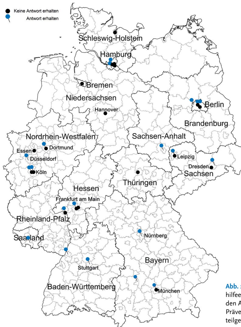
Abb. 2 | Standorte der niedrigschwelligen Drogenhilfeeinrichtungen, welche zur Befragung zu den Auswirkungen der COVID-19-Krise auf die Präventionsangebote eingeladen wurden und teilgenommen haben.

troffen. Diese sind zum Teil auch aktuell noch geschlossen. Im Rahmen eines Notbetriebs wurden von vielen Einrichtungen Strukturen wie die Essensausgabe und die Ausgabe von Konsumutensilien möglichst aufrechterhalten. Durch die Schließung von Wohnungslosenhilfen wurde berichtet, dass die niedrigschwelligen Drogenhilfeeinrichtungen vermehrt von Wohnungslosen für Angebote wie Essen, Duschen und die Kleiderkammer aufgesucht wurden.