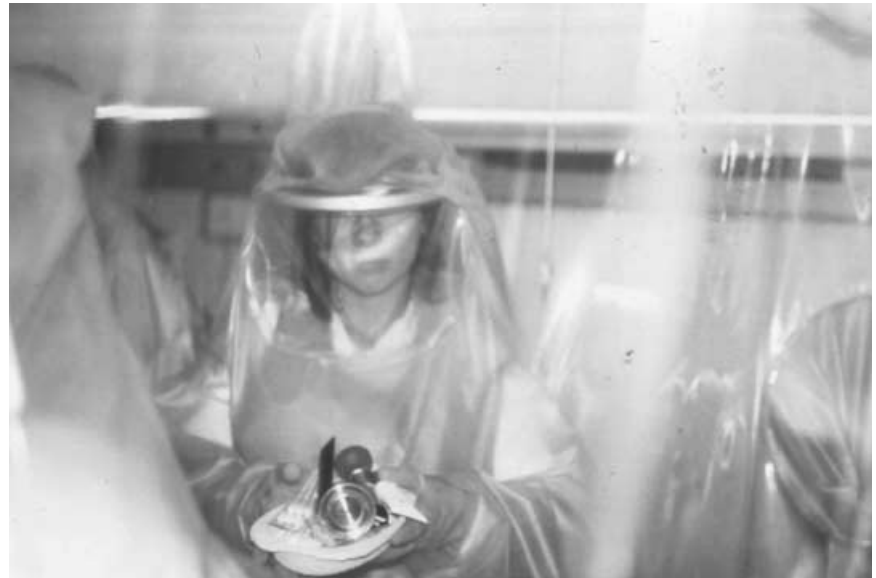
Abb. 2 ▲ Pflege und Manipulationen am Patienten sind ausschließlich über in die Zeltwand eingearbeiteten Handschuhe möglich

fachliche Kompetenz, die notwendige ständige Fortbildung und das Training des medizinischen Personals machen es unerlässlich, die Zahl dieser Einrichtungen auf das notwendige Minimum zu beschränken. In unserem ersten Entwurf hatten wir Behandlungs- und Kompetenzzentren in Hamburg, Berlin, München und Frankfurt am Main vorgeschlagen. Die Einbeziehung des im Juli 2000 in Betrieb genommenen und nach diesem Konzept speziell ausgerichteten Behandlungs- und Kompetenzzentrums in Leipzig ist eine sinnvolle Ergänzung des Versorgungskonzeptes. Die Isolierbetten der Behandlungszentren in Berlin und Hamburg [6] entsprechen u. E. nicht mehr dem Stand der Technik bzw. ermöglichen nicht die gegenwärtigen intensivmedizinischen Behandlungs-