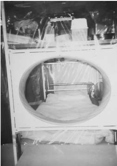
Abb. 1 ▲ Plastik-Isolierzelt mit Patienten-Schleuse (im Vordergrund) und Krankenbett