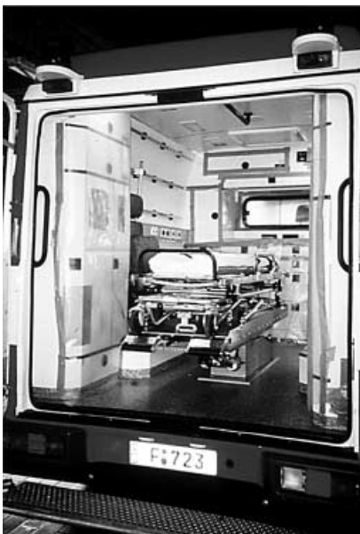
Abb. 4 ▲ Rettungswagen mit wannenartig ausgegossenem Boden. Schwer zugängliche Flächen sind mit Folie zugedeckt und abgeklebt. Nicht benötigte Ausrüstung ist entfernt

Die Einrichtung von fünf überregionalen Behandlungszentren ermöglicht Patiententransporte innerhalb von maximal vier bis fünf Stunden (vergl. Abb. 3). Der Transport muss einerseits eine Infektionsgefährdung von medizinischem Personal oder Dritten ausschließen, andererseits darf er Leben und Gesundheit des Patienten nicht gefährden. Ein notwendiger Krankentransport sollte deshalb (ohne Isolator) in einem serienmäßigen, für den Einzelfall "entkernten" Rettungswagen erfolgen. Der Rettungswagen sollte einen fugenlosen, wannenartig gegossenen Boden und einen leicht zu dekontaminierenden Innenraum haben. Für Isolationstransporte nicht benötigtes Material und Gerät ist vor dem Einsatz zu entfernen, schwer zugängliche Flächen sind mit Folie abzudecken (Abb. 4). Hierzu wird etwa eine Stunde benötigt. Ein Filtern der Abluft des Rettungstransportwa-