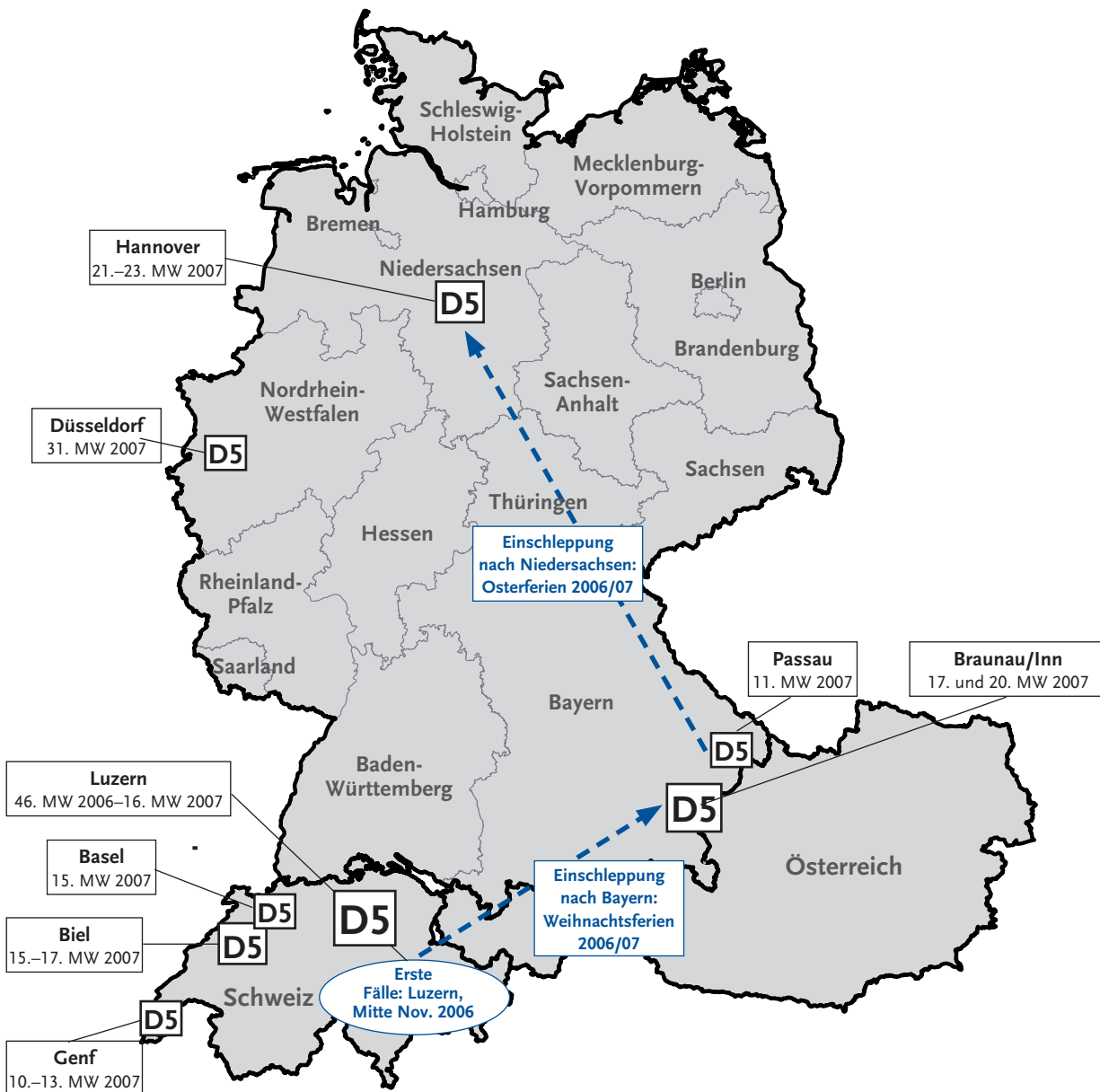
Abb. 1: Geografische Verteilung des D5-MV, welches die Ausbrüche in der Schweiz und in Niederbayern 2007 ausgelöst hat. Der Entnahmezeitpunkt des Untersuchungsmaterials für die MV-Genotypisierung ist als Meldewoche angegeben. Der vermutete Übertragungsweg wurde auf der Basis der MV-Nukleotidsequenzdaten und der epidemiologischen Falldaten rekonstruiert und ist durch gestrichelte blaue Pfeile gekennzeichnet.

Es lässt sich eine Übertragungskette rekonstruieren, die zeigt, dass sich das vermutlich aus Thailand oder Kambodscha eingeschleppte und zuerst in Luzern beobachtete D5-MV zunächst innerhalb der Schweiz, dann nach Niederbayern und von dort ausgehend sowohl nach Österreich (Region nahe der Grenze zu Deutschland) als auch nach Niedersachsen verbreitet hat und später auch nach NRW gelangt ist (s. Abb. 1). In den gegenwärtig betroffenen Ländern Mitteleuropas ist damit erstmalig eine nachhaltige Übertragung eines MV des Genotyps D5 beobachtet worden.