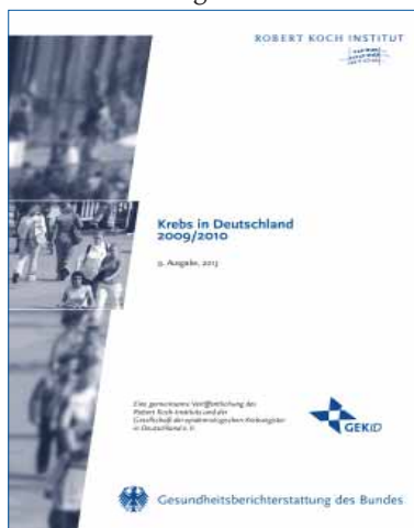
Abb. 1: Titelseite der Broschüre "Krebs in Deutschland 2009/2010" (RKI, GEKID 2013)

Herausgegeben wird die Broschüre "Krebs in Deutschland" alle zwei Jahre, zuletzt im Februar 2012. Die nun vorliegende, 9. Ausgabe basiert auf den anonymisierten Daten der epidemiologischen Krebsregister (EKR) der Bundesländer bis zum Jahr 2010. Mit dem Beginn der Erfassung der Krebsneuerkrankungen in Baden-Württemberg im Jahr 2009, hat die epidemiologische Krebsregistrierung in Deutschland nun formal Flächendeckung erreicht. Solange allerdings nicht alle epidemiologischen Krebsregister auftretende Krebsneuerkrankungen in ihren Ländern vollzählig erfassen, müssen für bundesweite Auswertungen die Zahlen der jährlichen Krebsneuerkrankungen weiter vom Zentrum für Krebsregisterdaten auf der Basis der vollzählig erfassenden Register berechnet und durch Schätzwerte ergänzt werden. 1